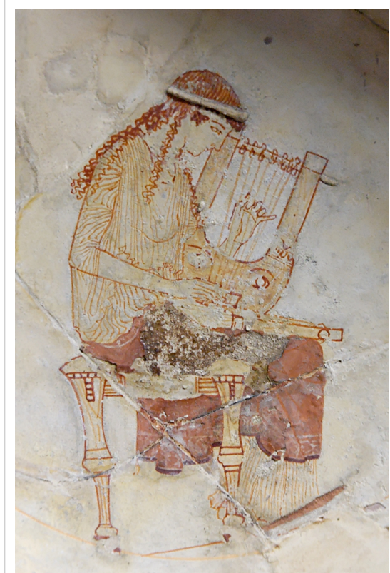
Μούσα που κουρδίζει την κιθάρα της. Εσωτερικό κυπέλλου από την Ερέτρια, περ. 470-460 π.Χ., Λούβρο

Τυφλός αιδός που αναφέρεται από τον Όμηρο πως ζούσε στην αυλή του Αλκίνοου, βασιλιά των Φαιάκων. Στη διάρκεια της φιλοξενίας του Οδυσσέα στο νησί των Φαιάκων ο Δημόδοκος τραγούδησε, ύστερα από παράκληση του Οδυσσέα, τις περιπέτειές του στην Τροία (τη φιλονικία του Οδυσσέα με τον