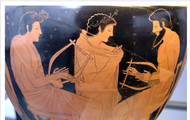
Μάθημα κιθάρας, αττική υδρία, περ. 510 π.Χ.

Ο Τέρπανδρος, ένας σπουδαίος μουσικός ανακάλυψε την μουσική γραφή και έτσι όλοι έπαιζαν τα διάφορα τραγούδια ομοιόμορφα. Δημιούργησε το "Νόμο", που ήταν τραγούδι προς τιμή του Απόλλωνα με συγκεκριμένη όμως κατασκευή. Υπήρχαν αυλητικοί, αυλωδικοί, κιθαριστικοί και κιθαρωδικοί "Νόμοι". Έρχεται και η γένεση της τραγωδίας όπου η μουσική βρήκε εφαρμογή στη συνοδεία του έργου, και ήταν ανάλογη με το περιεχόμενό του. Η τραγωδία γεννήθηκε από τον Διθύραμβο, όταν κάποιος σκέφτηκε ότι είναι δυνατόν να παριστάνονται