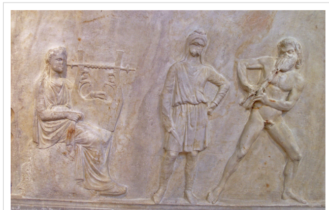
Ο Απόλλωνας (αριστερά) συναγωνίζεται με το Μαρσύα (δεξιά) που σε λίγο θα ηττηθεί και θα τιμωρηθεί από τον Σκύθη με το μαχαίρι. Ανάγλυφο, από την βάση της Μαντινείας μέσα 4ου αι. π.Χ.

Σύμφωνα με τον πρώτο, ο Μαρσύας προκάλεσε τον θεό Απόλλωνα υπερηφανεύομενος για τη μουσική τέχνη του. Πριν τον αγώνα συμφώνησαν ο νικητής να μεταχειρισθεί σύμφωνα τη θέλησή του τον νικημένο και διαιτητές ορίστηκαν οι Μούσες. Αρχικά φάνηκε να υπερέχει ο Μαρσύας που τελικά όμως νικήθηκε, οπότε ο Απόλλωνας τον κρέμασε σ' ένα δένδρο και τον έγδαρε. Ο μύθος