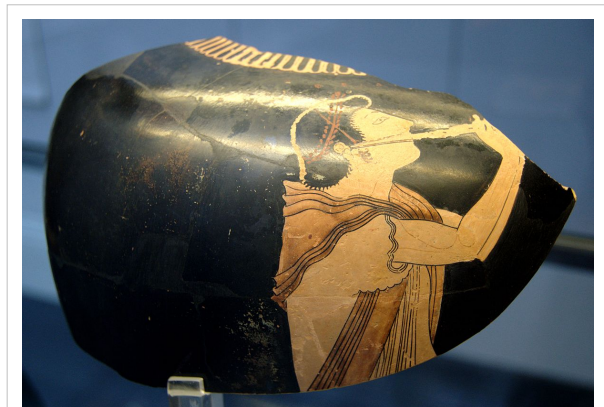
Αυλητής, ερυθρόμορφος αμφορέας, περ. 510 π.Χ., Αρχαιολογικό Μουσείο Μονάχου